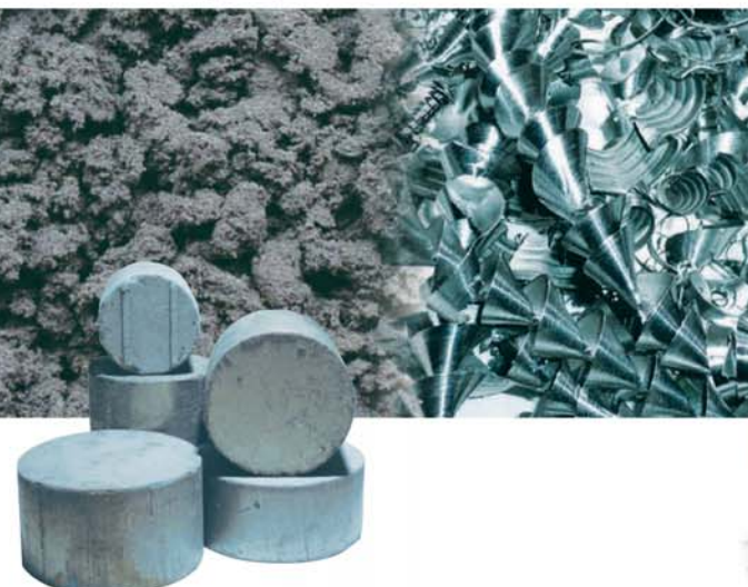
SCHLEIFSPÄNE Grinding chips